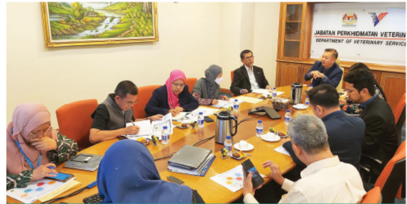
Pejabat Ketua Pengarah Perkhidmatan Veterinar, Putrajaya